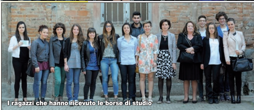
I ragazzi che hanno ricevuto le borse di studio