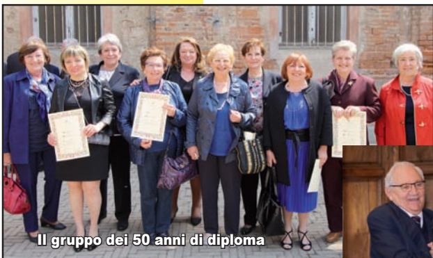
Il gruppo dei 50 anni di diploma