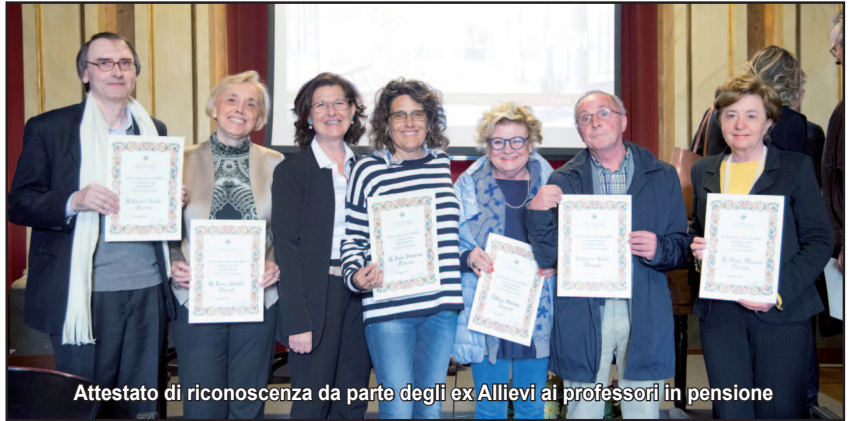
Attestato di riconoscenza da parte degli ex Allievi ai professori in pensione